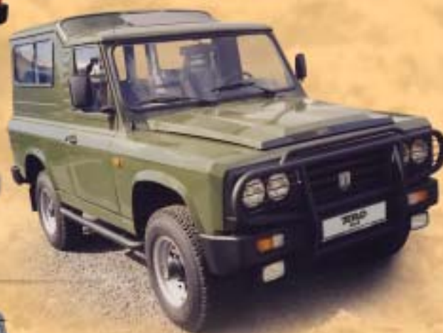
ARO 244 sport 5 míst