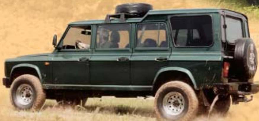
ARO 324 maxi taxi 7 + 2 místa 539.000,-

Ceny jsou uvedeny v Kč bez DPH a jsou platné v době tisku. Plátcí DPH uplatňují odpočet u všech modifikací. Společnost AUTO MAX si vyhrazuje právo změny.