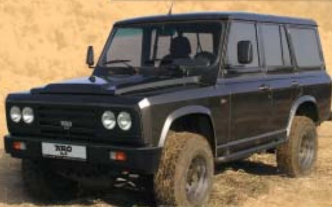
ARO 244 lux 5 míst