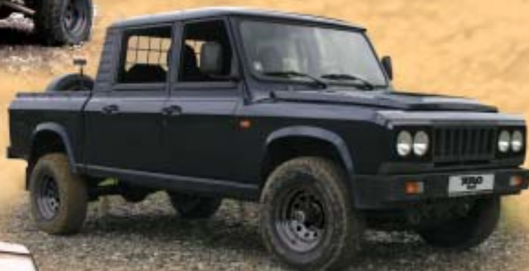
ARO 324 rodeo 5 míst 456.000,-