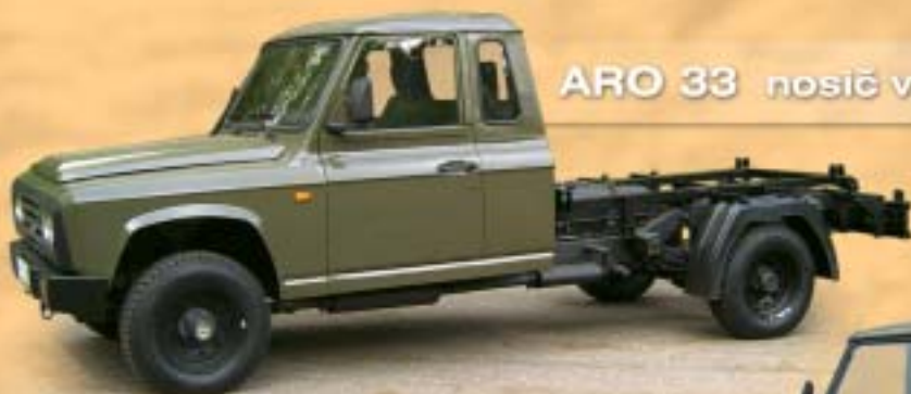
ARO 33 nosič výměnných nástaveb