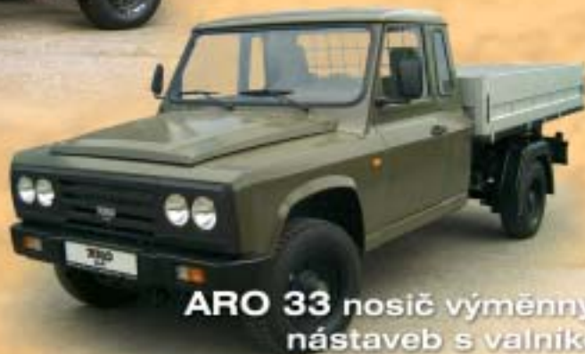
ARO 33 nosič výměnných nástaveb s valníkem