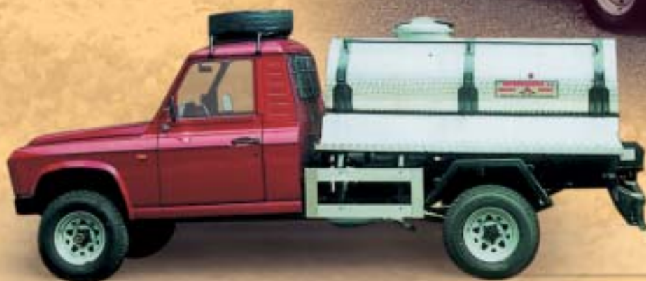
ARO 33 cisterna

Ceny jsou uvedeny v Kč bez DPH a jsou platné v době tisku. Plátcí DPH uplatňují odpočet u všech modifikací. Společnost AUTO MAX si vyhrazuje právo změny.