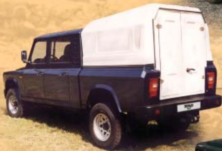
ARO 324 s nástavbou 5 míst 476.000,-