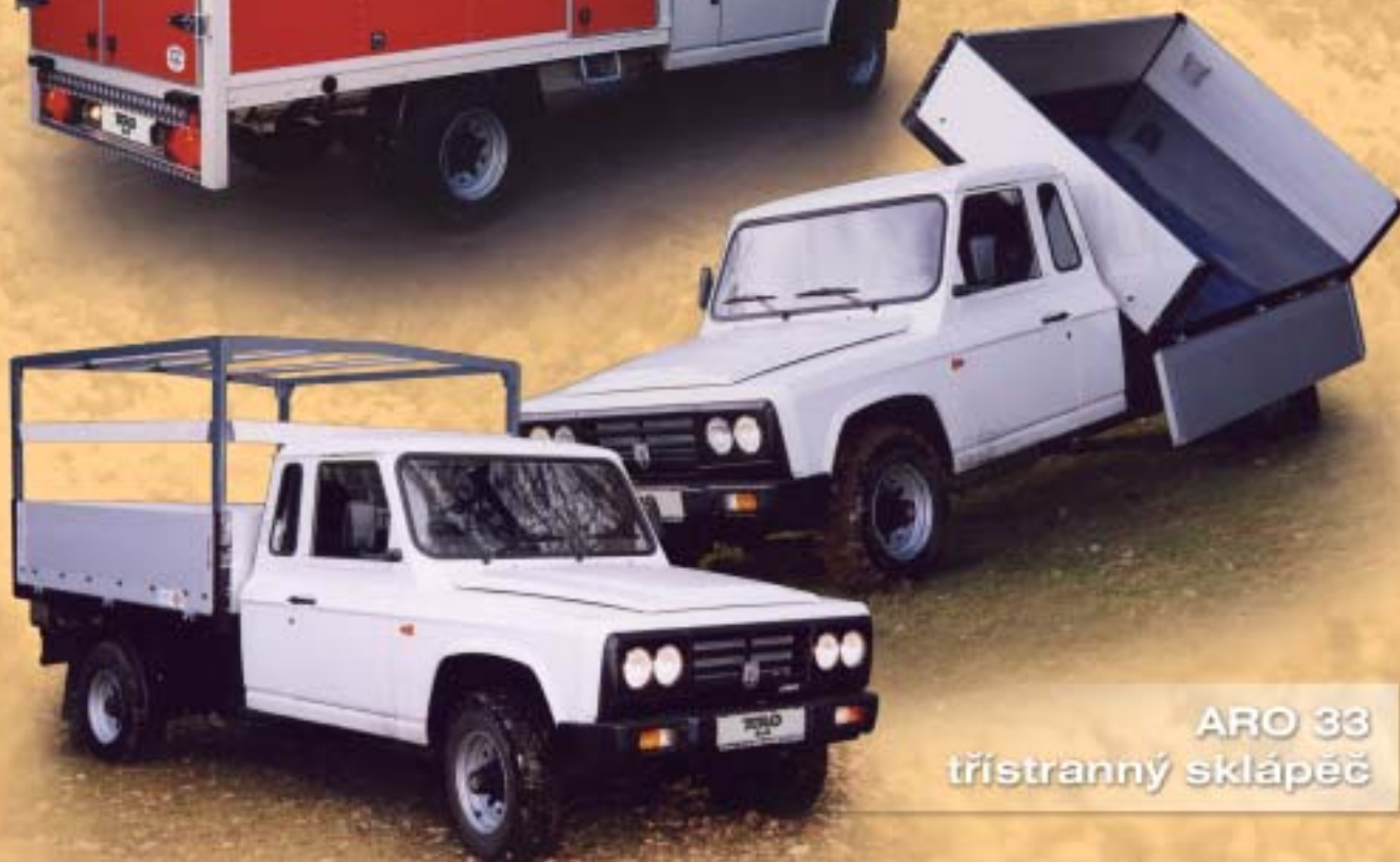
ARO 33 třístranný sklápěč