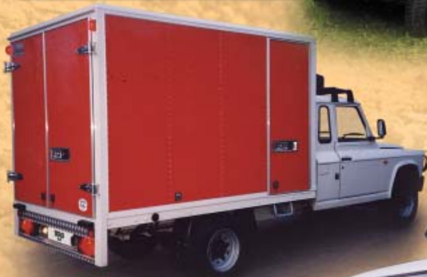
ARO 33 skříň