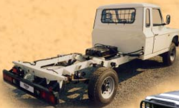
ARO 33 podvozek 2 místa 419.000,-

Robustní podvozek s možností využití pohonu 4x4 v náročných provozních podmínkách. Zákazníkům nabízíme celou škálu užitečných nástaveb podle individuálních požadavků. Nabídkové ceny zpracujeme na vyžádání.