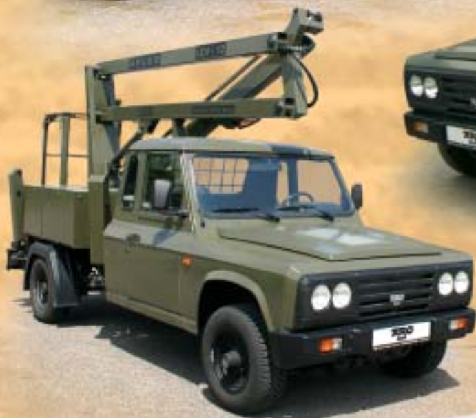
ARO 33 nosič výměnných nástaveb s pracovní plošinou