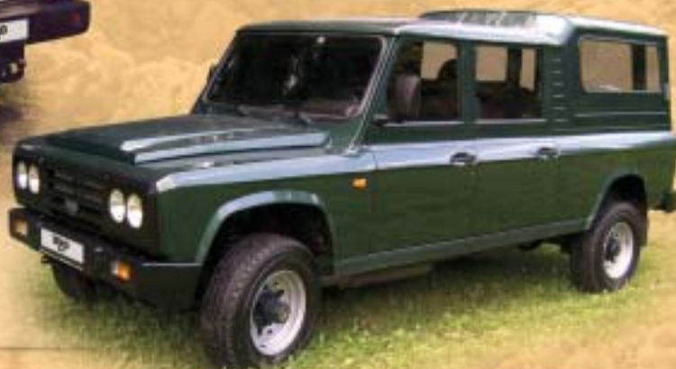
ARO 328 maxi 5 + 4 místa 479.000,-