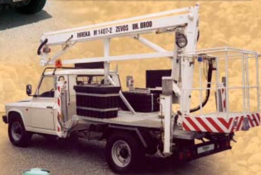
ARO 33 pracovní plošina