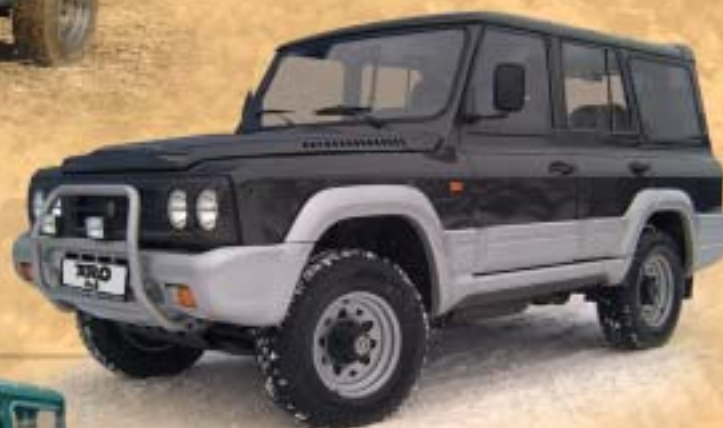
ARO 246 safari 5 + 2 místa