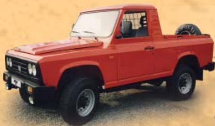
ARO 242 pick up 2 místa

Je určena uživatelům, kteří upřednostňují využití vozu v náročných terénních podmínkách. Svým rozvorem 2350 mm má vynikající jízdní schopnosti, zejména pak přechodové a nájezdové úhly nebo poloměr otáčení.