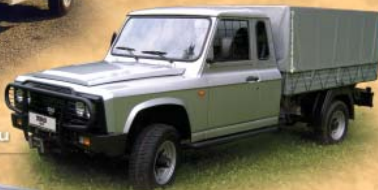
ARO 33 valník s plachtou