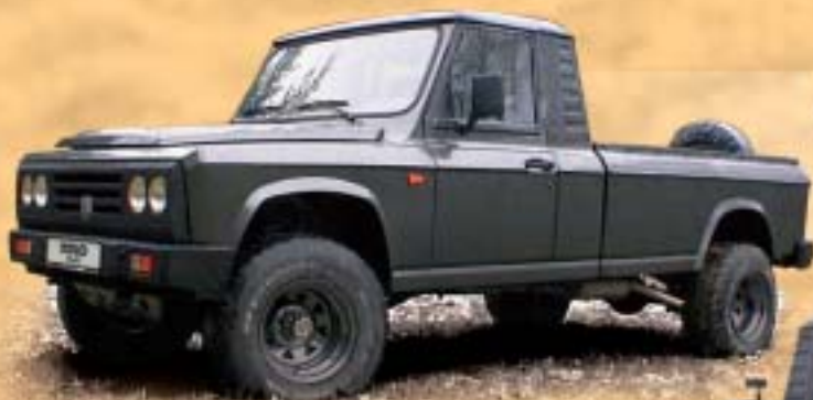
ARO 320 pick up 2 místa 449.000,-

Nabízí uživatelům bezkonkurenční prostor, variabilitu a užitečné zatížení. Vozidla této řady si přitom zachovávají velmi dobré jízdní vlastnosti v terénu.